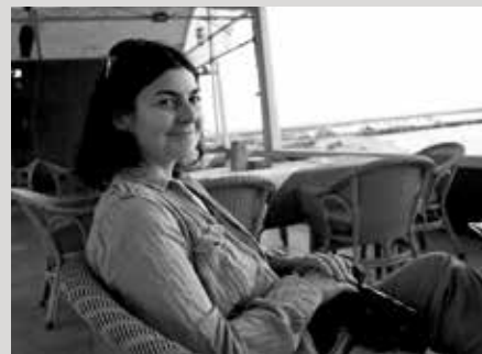
La photographe Anne Paq

Nous avons le plaisir d'offrir aux spectateurs du Festival, avant chaque film, un diaporama présentant des photos inédites réalisées à Gaza par la photographe Anne Paq, membre du groupe Activestills. ( http://www.activestills.org/ ).